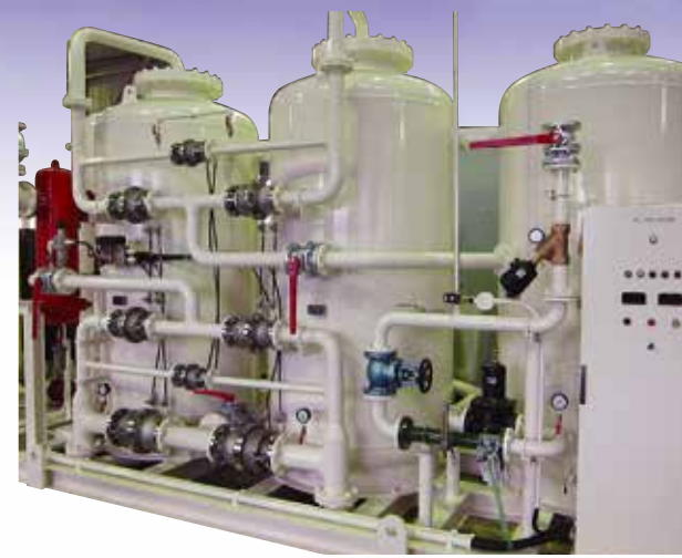
大型オープンタイプ